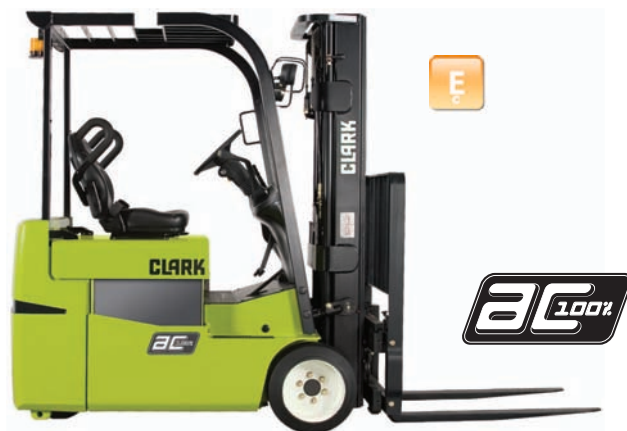
TMX 13/15s 3-ROUES 48 VOLT Электрический погрузчик 13 15s 1300 1500 KG