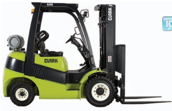
C20/25/30/35 ГАЗ/ДИЗЕЛЬ Погрузчик с двигателем внутреннего сгорания и пневматическими или суперэластичными шинами 20 25 30 35 2000 2500 3000 3500 кг