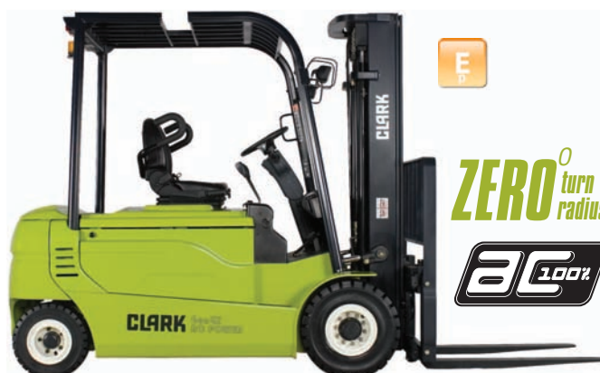
GEX 20/25/30/30s/30L 4-КОЛЕСНЫЙ 80 ВОЛЬТ Электрический погрузчик 20 25 30s 30 30L 2000 2500 3000 3000 3000 KG