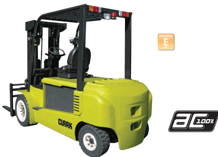
GEX 40/45/50 4-КОЛЕСНЫЙ 80 ВОЛЬТ Электрический погрузчик 40 45 50 4000 4500 5000 KG