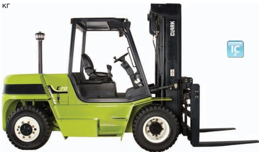
C60/70/75/80 ГАЗ/ДИЗЕЛЬ Погрузчик с двигателем внутреннего сгорания и пневматическими или суперэластичными шинами 60 70 75 80 6000 7000 7500 8000 кг