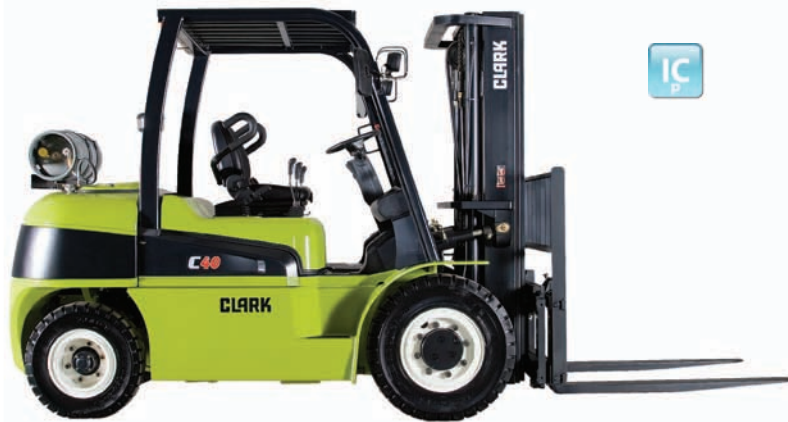
C40/45/50s/55s ГАЗ/ДИЗЕЛЬ Погрузчик с двигателем внутреннего сгорания и пневматическими или суперэластичными шинами 40 45 50s 55s 4000 4500 5000 5500 кг