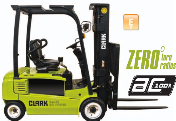
GEX 16/18/20s 4-КОЛЕСНЫЙ 48 ВОЛЬТ Электрический погрузчик 16 18 20s 1600 1800 2000 KG