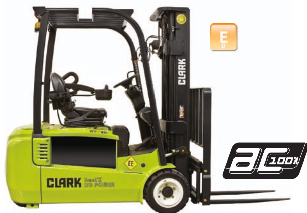
GTX 16/18/20s 3-КОЛЕСНЫЙ 48 ВОЛЬТ Электрический погрузчик 16 18 20s 1600 1800 2000 KG