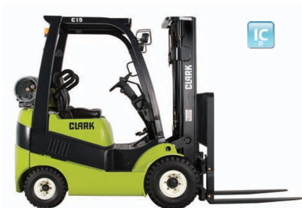
C15/18/20s ГАЗ/ДИЗЕЛЬ Погрузчик с двигателем внутреннего сгорания и пневматическими или суперэластичными шинами 15 18 20s 1500 1800 2000 кг