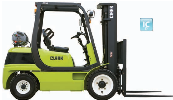
CQ 20/25/30 ГАЗ/ДИЗЕЛЬ Погрузчик с двигателем внутреннего сгорания и пневматическими или суперэластичными шинами 20 25 30 2000 2500 3000 кг